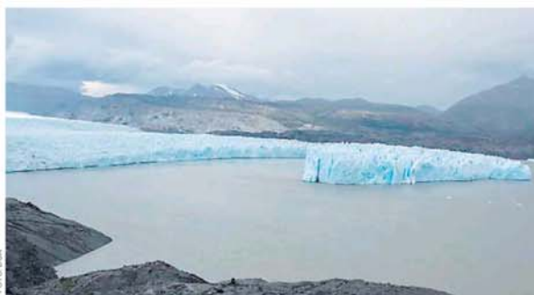
► Témpano que se generó en el glaciar Tyndall, también ocurrido en 2017.

Desde la DGA agregan que los glaciares con frentes terminales en Tierra del Fuego, y son más inestables que aquellos glaciares que terminan en tierra, los que se distribuyen principalmente en la zona norte y central de la cordillera Andina. ●