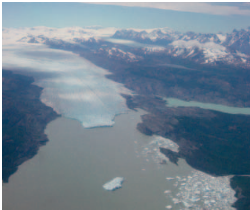
1. Frente terminal del glaciar Tyndall en el Lago Geikie, que se halla en el Campo de Hielo Patagónico Sur, parque nacional Torres del Paine, Chile. Este glaciar ha experimentado un adelgazamiento promedio de 3,2 \pm 0,6 metros por año entre 1975 y 2002.

La mayoría de los glaciares patagónicos tienen la particularidad de presentar frentes “desprendentes”, que arrojan témpanos a lagos y fiordos. Se piensa que los glaciares de este tipo son más sensibles a los cambios climáticos que los glaciares de montaña sin desprendimiento de