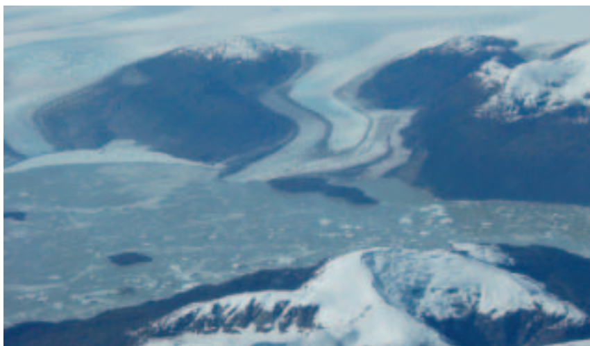
2. El glaciar Greve, del Campo de Hielo Patagónico Sur, presenta un frente en el lago homónimo creado por el avance del vecino glaciar Pio XI, que embalsó un valle de más de 200 km 2 de superficie.