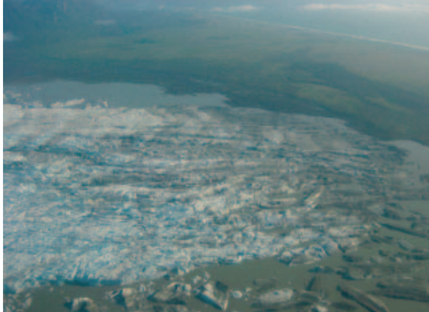
3. Lengua terminal del glaciar San Quintín, en el margen occidental del Campo de Hielo Patagónico Norte. Desde 1993, el frente ha retrocedido aceleradamente. Donde la lengua se derrumba y transforma en miles de témpanos se ha generado un lago proglacial.

Si bien se perciben retrocesos y adelgazamientos en la mayoría de los glaciares patagónicos, no todos han respondido de la misma forma. Hay uno que incluso avanzó. Se trata del glaciar Pío XI o Brügger, el más grande del Campo de Hielo Patagónico sur, con 1250 km 2 de superficie y 65 kilómetros de largo, que entre 1945 y 1994 ganó cerca de 9 kilómetros, destruyendo a su paso árboles de hasta 400 años de edad. Otros glaciares, como el Perito Moreno, han presentado un equilibrio de sus frentes, con retrocesos menores y avances ocasionales como el ocurrido a finales de 2003, cuando el glaciar embalsó el Brazo Rico del Lago Argentino, lo que provocó, en marzo de 2004, una ruptura espectacular del frente del glaciar cuando el lago embalsado con cerca de 10 metros de desnivel con respecto al